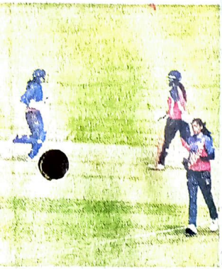
संभालने की तैयारी करती हुई।