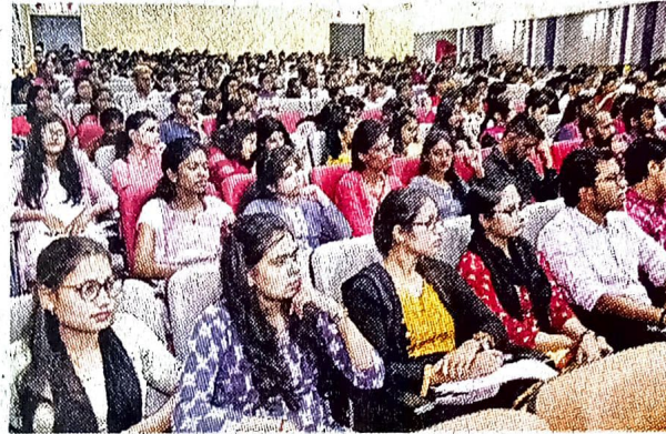
बीआईटी में हुई कार्यशाला के दौरान ट्विनसिटी के स्टूडेंट्स मौजूद रहे।

साथ ही सॉलिड वेस्ट मैनेजमेंट, इंटरनेट थिंग्स, ब्लॉक चेन टेक्नोलॉजी और ई कॉमर्स में स्टार्ट अप की अपार संभावनाएं हैं। लघु व्यापार एवं उद्योग के संबंध में हुई कार्यशाला में उन्होंने स्टार्ट अप योजनाओं के बारे में कहा कि नए क्षेत्र में काम करने के लिए युवाओं को नए इनोवेशन के साथ सामने आना होगा। देश लाभांश के दौर से गुजर रहा है। स्टार्ट अप इंडिया का क्रियान्वयन व शैक्षणिक संस्थाओं को स्टार्ट-अप हब के रूप में विकसित कर युवाओं की ऊर्जा सही दिशा में उपयोग की जा सकती है।