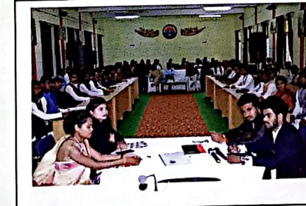
महाविद्यालय में राजनीति विभाग द्वारा छात्र-सांसद का आयोजन