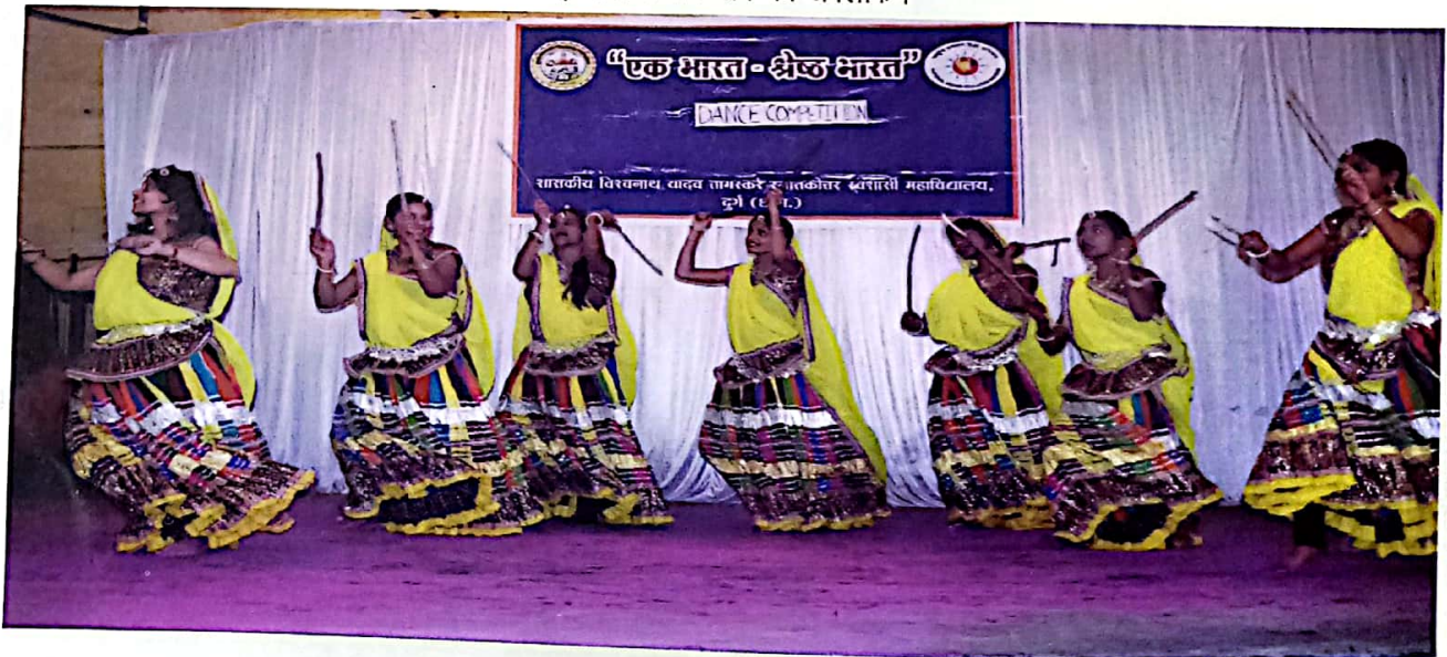
महाविद्यालय में 'एकभारत-श्रेष्ठभारत' कार्यक्रम के अंतर्गत नृत्य प्रस्तुत करती हुई छात्राएं

प्राचार्य, शासकीय विश्वनाथ यादव तामस्कर स्नातकोत्तर स्वशासी महाविद्यालय, दुर्ग (छ.ग) द्वारा प्रकाशित एवं .....AD.....द्वारा मुद्रित