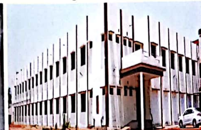
रूसा द्वारा निर्मित नवीन व्याख्यान कक्ष