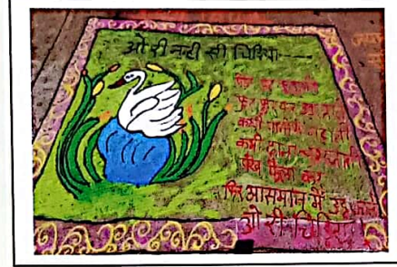
वनविभाग द्वारा आयोजित पक्षी उत्सव में छात्राओं ने बनाया रंगोली