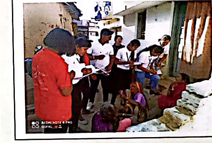
रेडक्रास सोसायटी के विद्यार्थियों द्वारा कोरोना जागरूकता कार्यक्रम