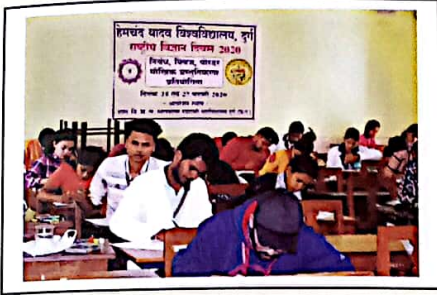
राष्ट्रीय विज्ञान दिवस पर निबंध एवं पोस्टर प्रतियोगिता का आयोजन