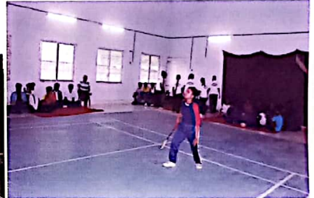
इन्दोर बैडमिंटन हॉल