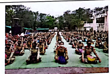
प्रशिक्षण प्राप्त करते हुए एन सी सी के कैडेट