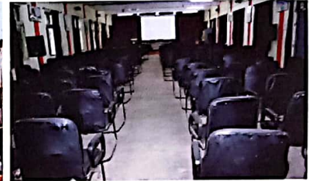
रवीन्द्रनाथ टैगोर सेमीनार हॉल