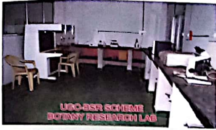
वनस्पति शास्त्र प्रयोगशाला

महा. में उपलब्ध छात्रावास, प्रयोगशालायें, ग्रंथालय, सेमीनार हॉल एवं खेलकूद संसाधनों की झलक