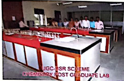
रसायन शास्त्र प्रयोगशाला