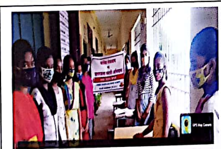
मानव विज्ञान विभाग द्वारा कोविड-19 के संबंध में जागरूकता कार्यक्रम