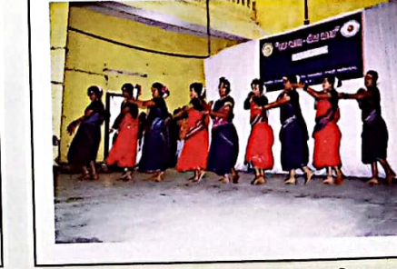
एक भारत-श्रेष्ठ भारत"-सांस्कृतिक कार्यक्रम का एक दृश्य