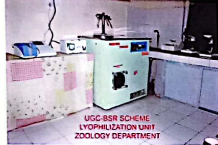
प्राणी शास्त्र प्रयोगशाला