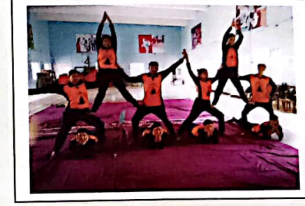
योगाभ्यास करते हुए योगदर्शन विभाग के विद्यार्थी