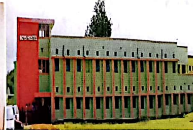
छात्रों हेतु उपलब्ध महा का छात्रावास