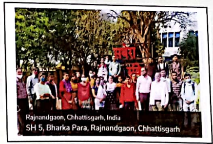
स्नातकोत्तर हिन्दी विभाग द्वारा दैनिक सबेरा संकेत का शैक्षणिक भ्रमण