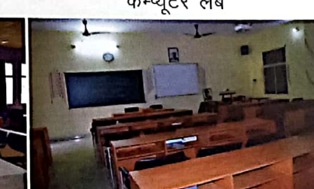
भौतिक शास्त्र स्मार्टक्लास रूम