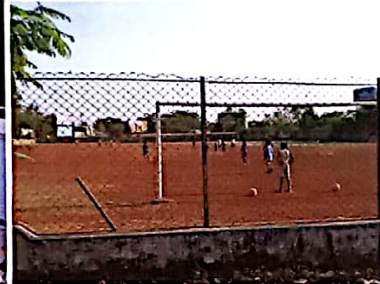
महाविद्यालय कीडा मैदान