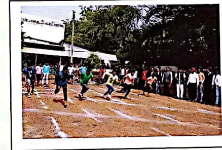
वार्षिक खेलकूद प्रतियोगिता में भाग लेते विद्यार्थी