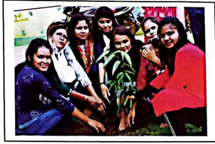
वृक्षारोपण करते हुए रा.से.यो. इकाई की छात्राएं