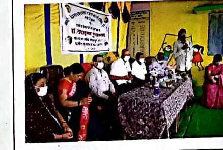
अंग्रेजी विभाग द्वारा गोदग्राम में ग्रामीण पुस्तकालय का उद्घाटन