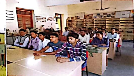
स्नातकोत्तर व्याख्यान कक्ष