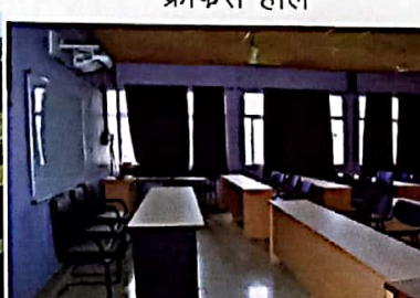
एपीजे स्मार्ट क्लास रूम