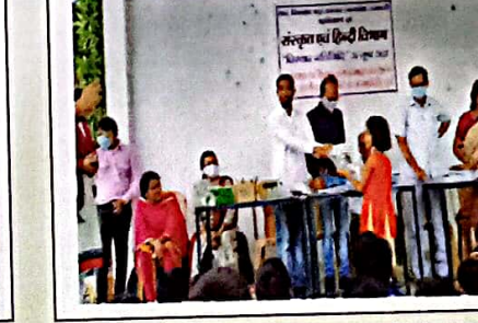
संस्कृत एवं हिन्दी विभाग द्वारा स्वास्थ्य एवं शिक्षा जागरूकता कार्यक्रम